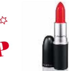
MAC-тан аты аңызға айналған Matte Lipstick ерін далаптары, MAC дүкенінде Легендарная губная помада Matte Lipstick от MAC