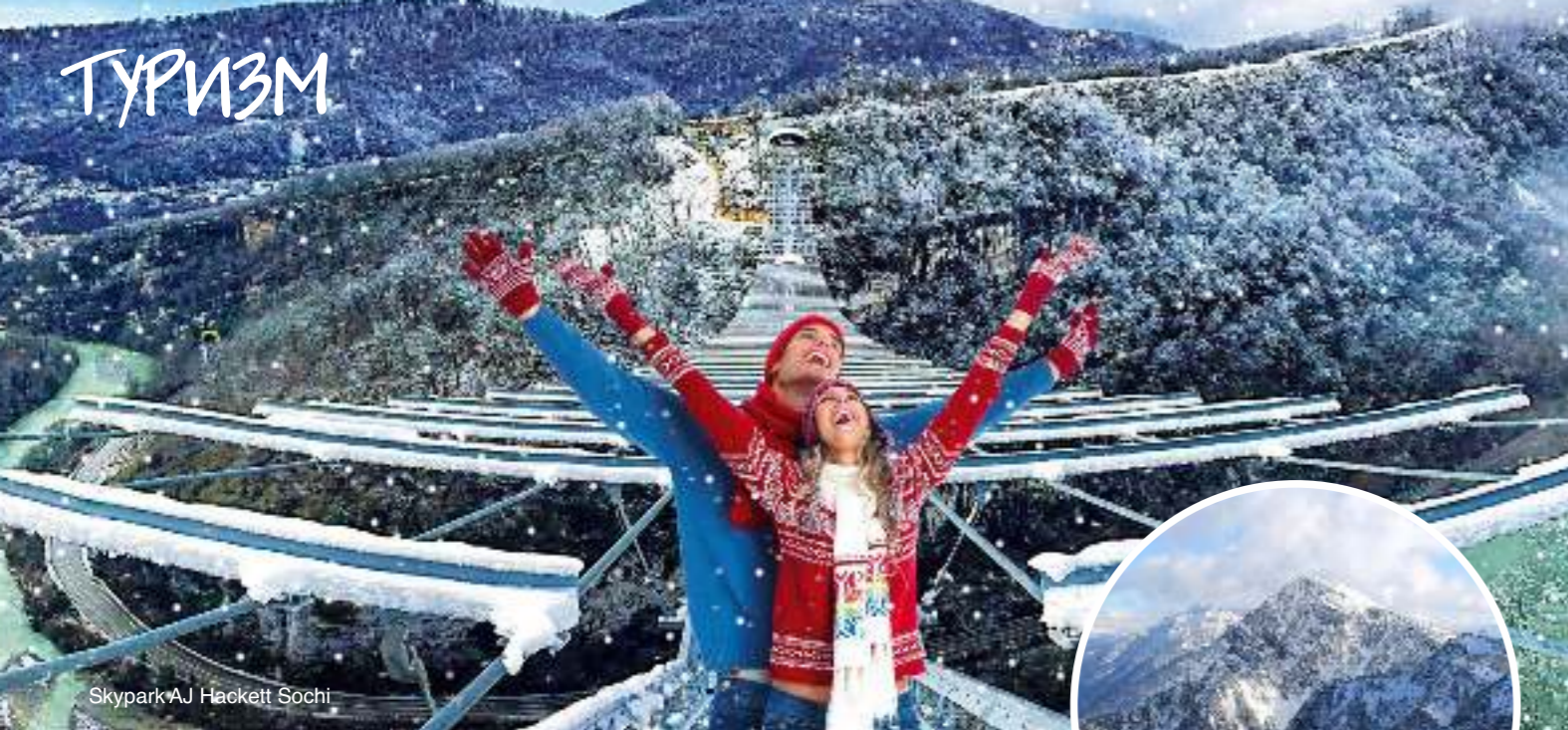
SkyPark AJ Hackett Sochi