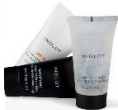
Under Makeup Base