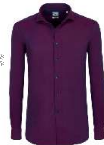
100% мақтадан жейделер, CAMICISSIMA дүкенінде Рубашки из 100% хлопка от CAMICISSIMA