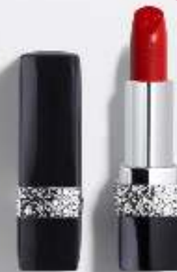
Rouge Dior Bijou