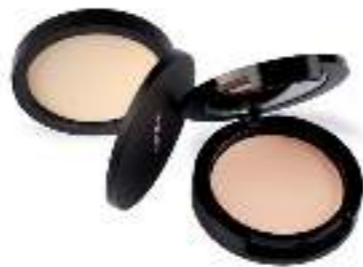
HD Pressed Powder