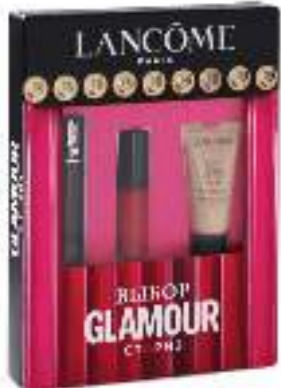
Набор «Glamour Сториз» от LANCÔME (тональный крем, тушь для ресниц, блеск для губ)