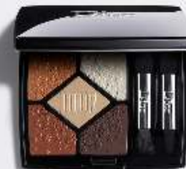
5 Couleurs Midnight Wish