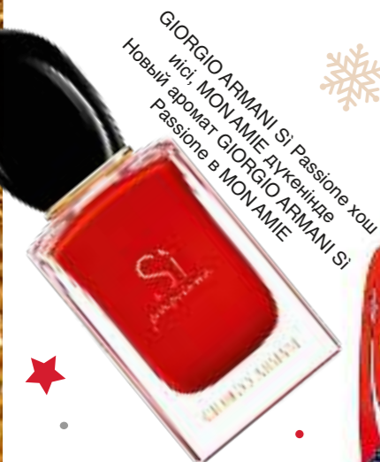
GIORGIO ARMANI Si Passione хош иісі, MON AMIE дүкенінде Новый аромат GIORGIO ARMANI Si Passione в MON AMIE