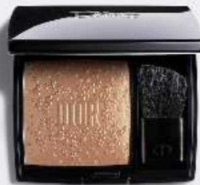
Rouge Blush Midnight Wish

В Новый год особенно хочется быть яркой и неповторимой. Новогодний праздничный макияж должен быть запоминающимся! Не пренебрегайте праймером. Макияж, нанесенный поверх базы, продержится гораздо дольше. Средства с шиммером — то, что нужно для Нового года! Попробуйте тени, хайлайтер или пудру с блестящими частицами. Не забывайте про румяна. Успех любого макияжа — стойкая помада. Smoky eyes в оттенках серебра, золота, платины отлично подойдут для новогоднего make up. В магазинах «Хан Шатыр» вы найдете самые последние новинки косметики для создания вашего неповторимого образа.