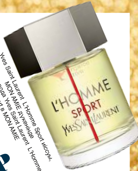
Yves Saint Laurent L'Homme Sport иісуы, Туалетная вода Yves Saint Laurent L'Homme Sport в MON AMIE