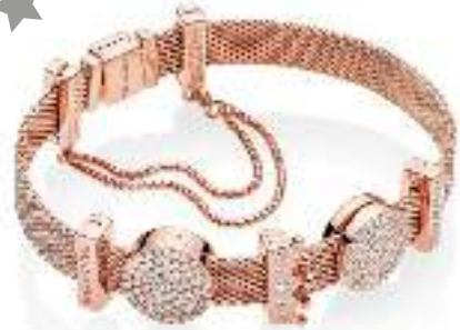
PANDORA Reflexions жаңа топтамасының білезіктері мен шармдары Новые браслеты и шармы PANDORA Reflexions