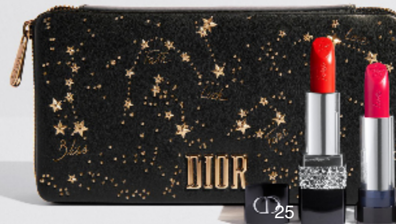
Rouge Dior Coffret Couture Collection