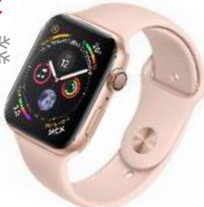
Apple Watch Series 4 смарт-сағаттары, SULPAK дүкенінде Смарт-часы Apple Watch Series 4 в SULPAK