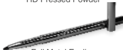
Full Metal Eyeliner