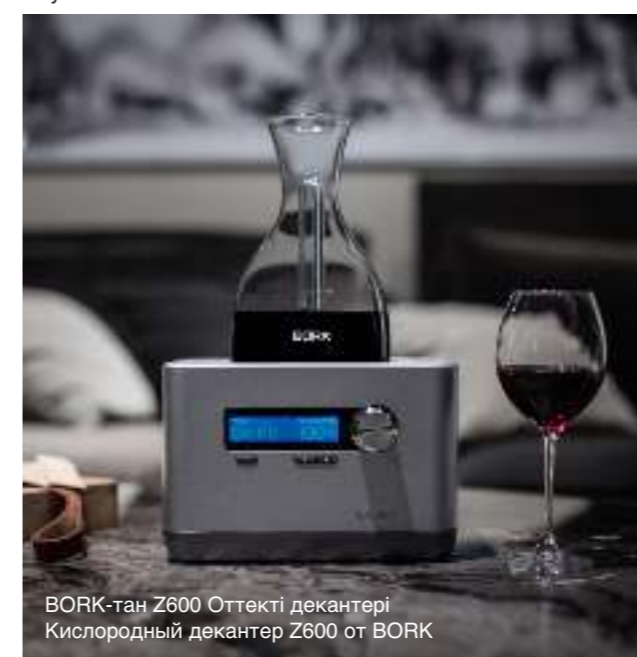
BORK-тан Z600 Оттекті декантері Кислородный декантер Z600 от BORK