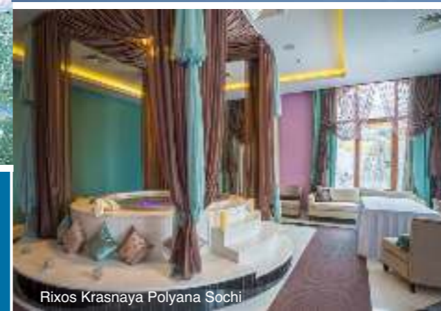
Rixos Krasnaya Polyana Sochi