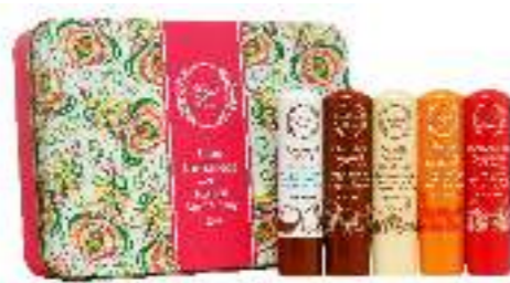
Ерінге арналған бальзамдар жинағы, FRESH LINE дүкенінде Набор бальзамов для губ от FRESH LINE