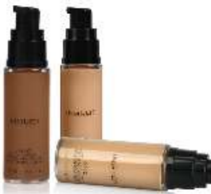
AMC Cream Foundation

Жаңа жыл қарсаңында жарқын және ерекше болғымыз келеді. Жаңа жылдық мерекелік макияж есте қаларлықтай болуы тиіс! Праймерді менсінбеуге болмайды! Негіздің қолдылуымен жасалған макияж біраз уақытқа дейін сақталады. Жаңа Жылға нағыз қажеттінің бірі - құрамында шимері бар бояу! Далап, хайлайтер және жылтыр түйіршікті опаны қолданып көріңіз. Еңлік туралы да ұмытпаңыз! Кез-келген макияждың жетістігі - ерін далабы. Күміс, алтын, платина реңдерінде жасалған Smoky eyes жаңа жылдың make up-қа дәл келеді. Сіздің есте қаларлық, қайталанбас кейіпіңізді бейнелейтін косметиканың ең соңғы топтамаларын "Хан Шатыр" дүкендерінен таба аласыз.