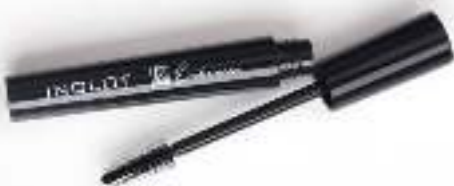
Lash Enhancer Mascara