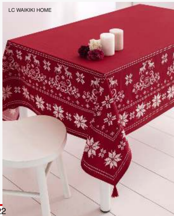
LC WAIKIKI HOME

Актуален лаконичный и минималистичный стиль в интерьере, но даже его вы можете сделать новогодним. Подберите нужные детали именно для вашего дома.