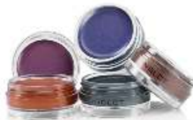
AMC Eyeliner Gel