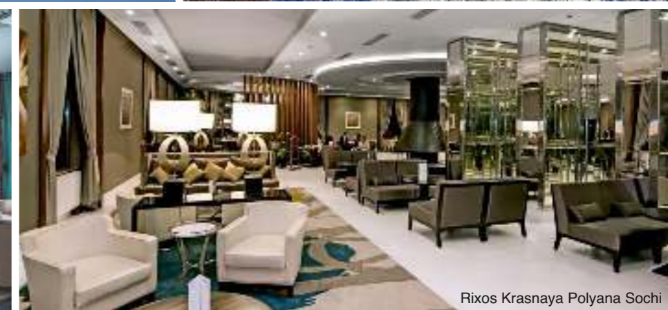
Rixos Krasnaya Polyana Sochi