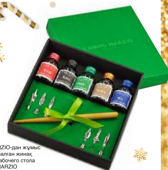
CAMPO MARZIO-дан жұмыс үстеліне арналған жинақ Набор для рабочего стола от CAMPO MARZIO