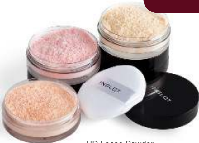
HD Loose Powder