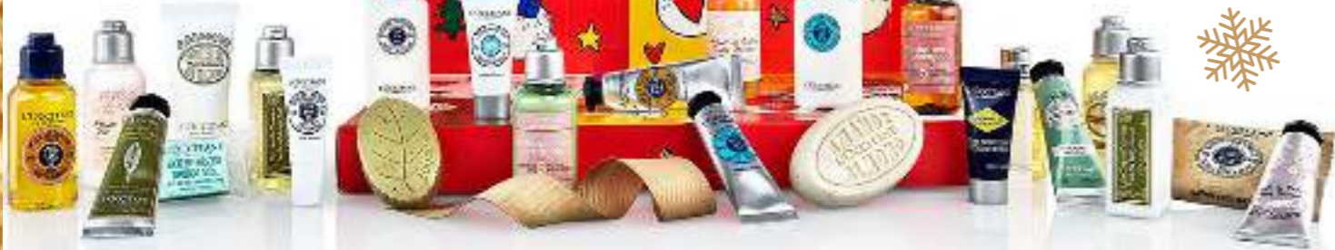
«Классикалық оқиғалар күнтізбес» атты күнделікті күтімі, L'OCCITANE дүкенінде