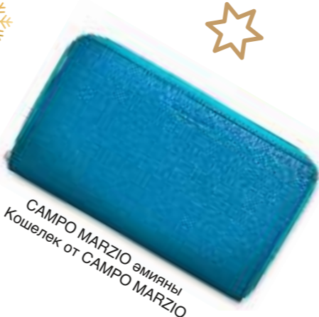
CAMPO MARZIO әмияны Кошелек от CAMPO MARZIO